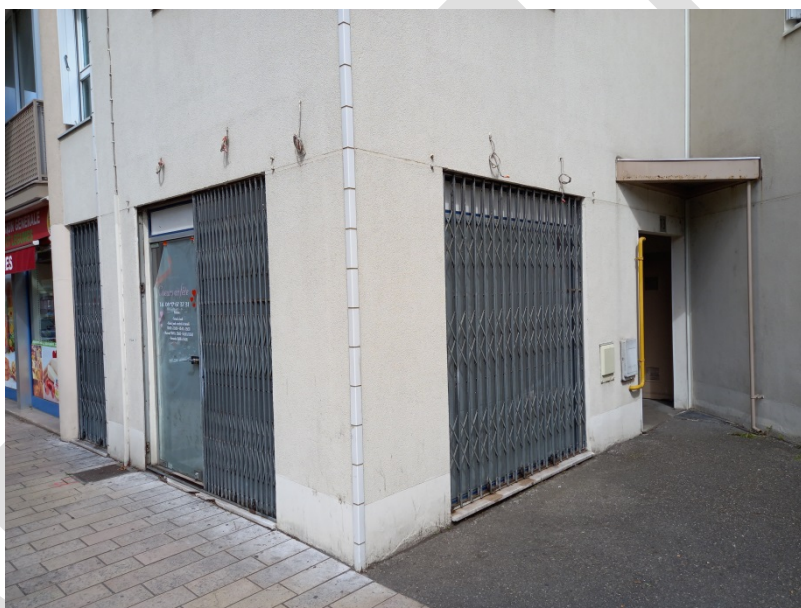
Façades avant et latérale du local

Le local ne dispose pas de cave ni de grenier associé. Il est compris dans un ensemble immobilier géré en copropriété.