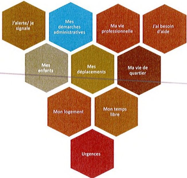
Figure 2 : Périmètre cible du guichet numérique

Le périmètre du bouquet de services est évolutif. Il est prévu d'avoir des versions successives du Guichet Numérique Métropolitain pour atteindre progressivement le périmètre cible suivant.