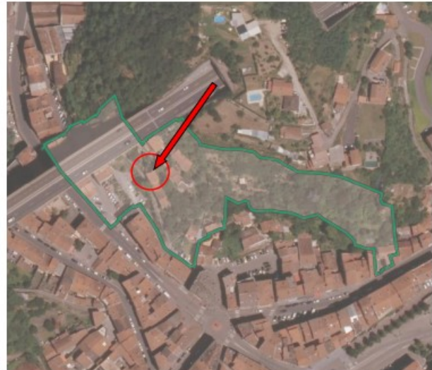
Plan périmètre convention (cad. ou orthophoto) :