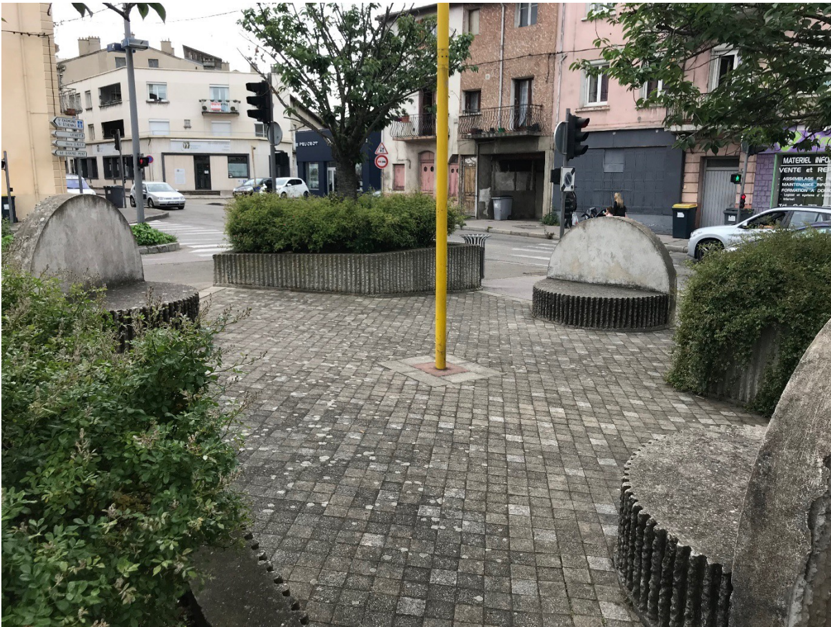
Figure 1: square croisement rue Claude Drivon et passage des Gendarmes

Dans ces 3 fosses, il conviendra de planter des haies constituées de végétaux locaux tels que buis commun, houx commun, noisetier commun, viorne lantane, églantier, fusain d'Europe, sureau noir de taille 60/80. Les plants devront être plantés tous les 50cm. Pour garantir une reprise optimale de végétaux, il conviendra d'ajouter dans ces fosses 20cm de terre, équivalent à 2m 3 de terre pour les 3 fosses.