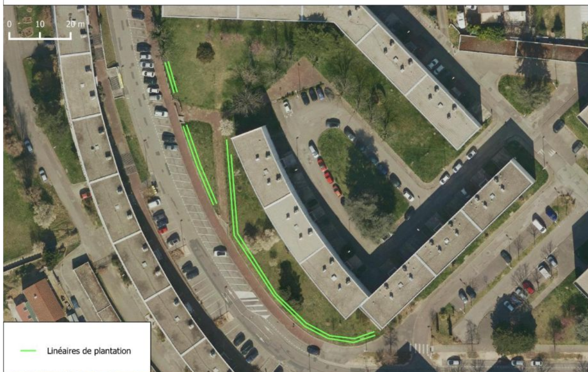
Plantations de haies à Grigny secteur "Rue de la République"