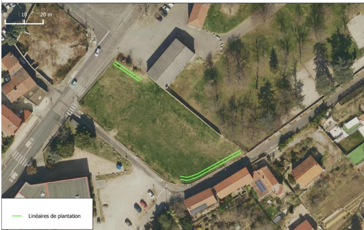
Plantations de haies à Grigny secteur "Parc aux Oiseaux"