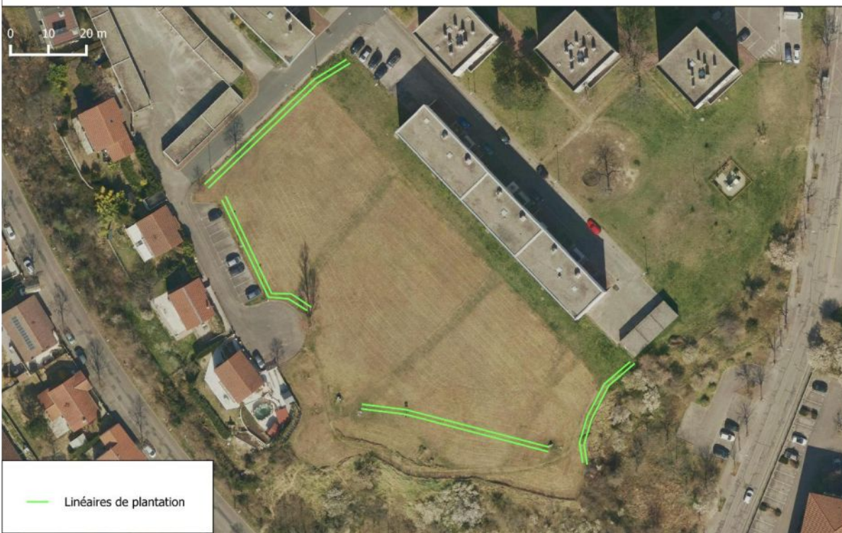
Plantations de haies à Grigny secteur "Forêt des Ecoliers"