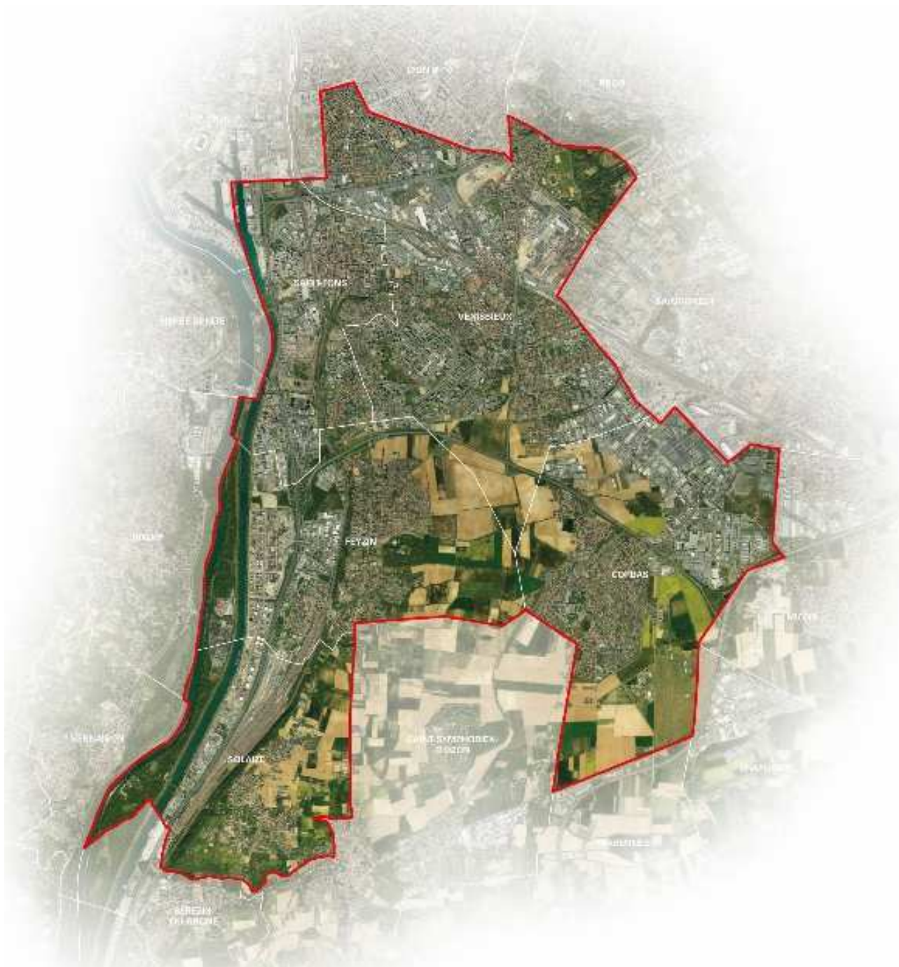
CTM Les Portes du Sud