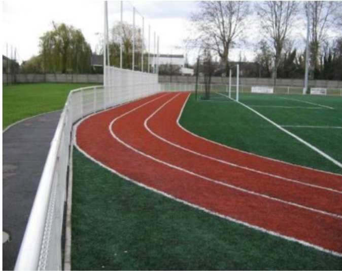
Mise en place d'une piste de course en gazon synthétique