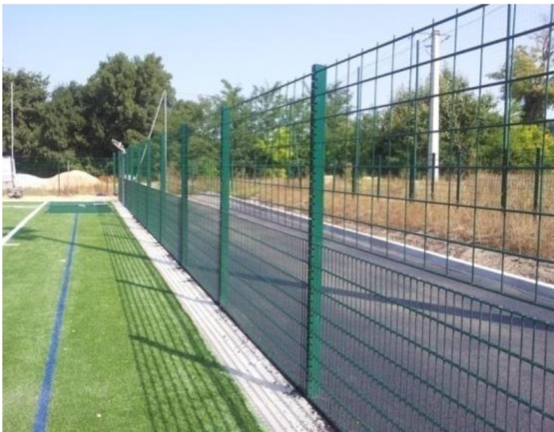
Grillage de type ligue méditerranéenne