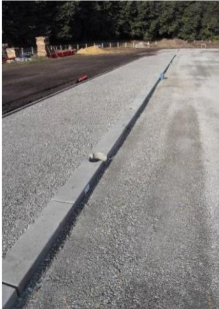
Bordurage 13 x 25 permettant l'intégration d'une main courante