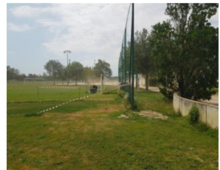
Point de base pour la calage du futur terrain