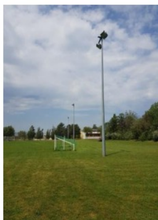
Eclairage existant à 3 masts par côté

Hauteur minimale pour un porte char : 4,35 m