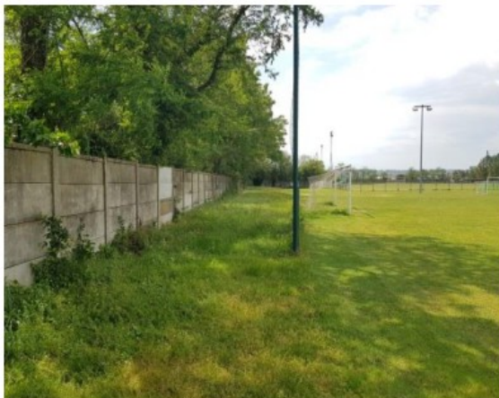
Passage à maintenir pour le cross