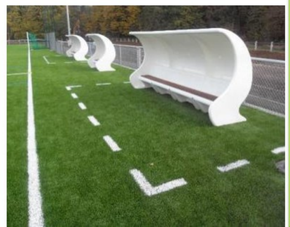
Abris de touche monobloc sans boulonnerie (hors fixation au sol)