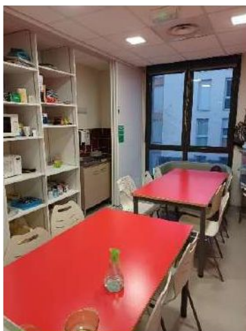
Tisanerie 1 er étage particulièrement d'attente

Ils accompagnent les PMR vers l'Espace d'Attente Sécurité (EAS) le plus proche (2e étage: tisanerie; 3e étage: terrasse) ou l'extérieur, et restent avec elles jusqu'à l'arrivée des secours. En l'absence d'agent désigné, tout agent du pôle assure cette sécurité.