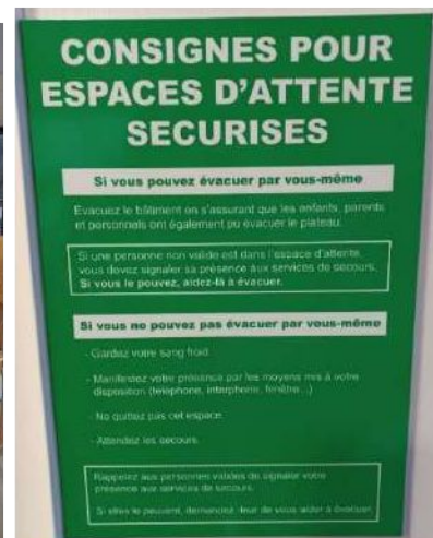
Consignes pour espace