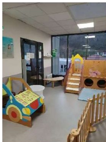
Atrium 3 ème étage