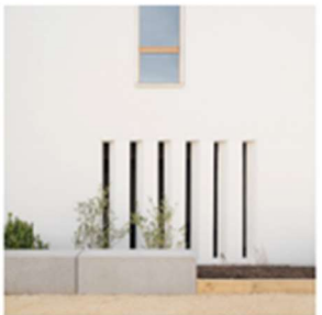
Profil en creux dans mur de façade Ensemble des locaux techniques et locaux vélos