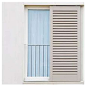
Volets métalliques à lames orientables occultation de l'ensemble des ouvertures Nord et Ouest