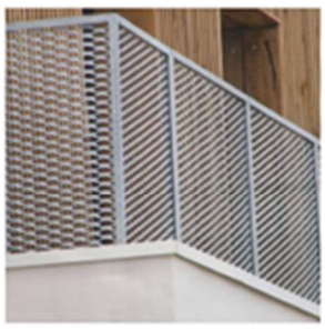
Garde corps en métal déployé Sur ensemble des loggias