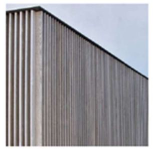
Bardage bois à lames verticales Fond de loggia