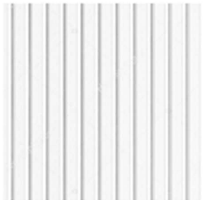
Bac acier aspect joint debout teinte gris clair assorti à la lasure Ensemble des toitures