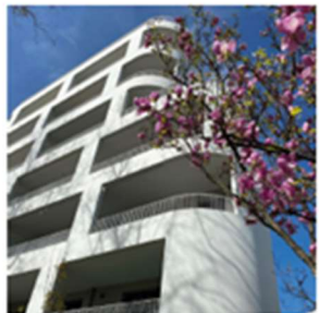
Béton lasuré Sur l'ensemble des façades