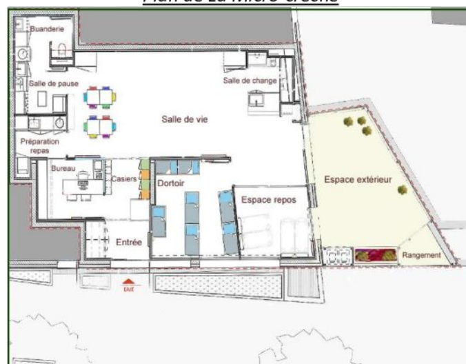
Plan de La Micro-crèche

Toute famille inscrivant son enfant au sein de La Micro-crèche doit avoir pris connaissance des projets éducatif et pédagogique et y adhérer.