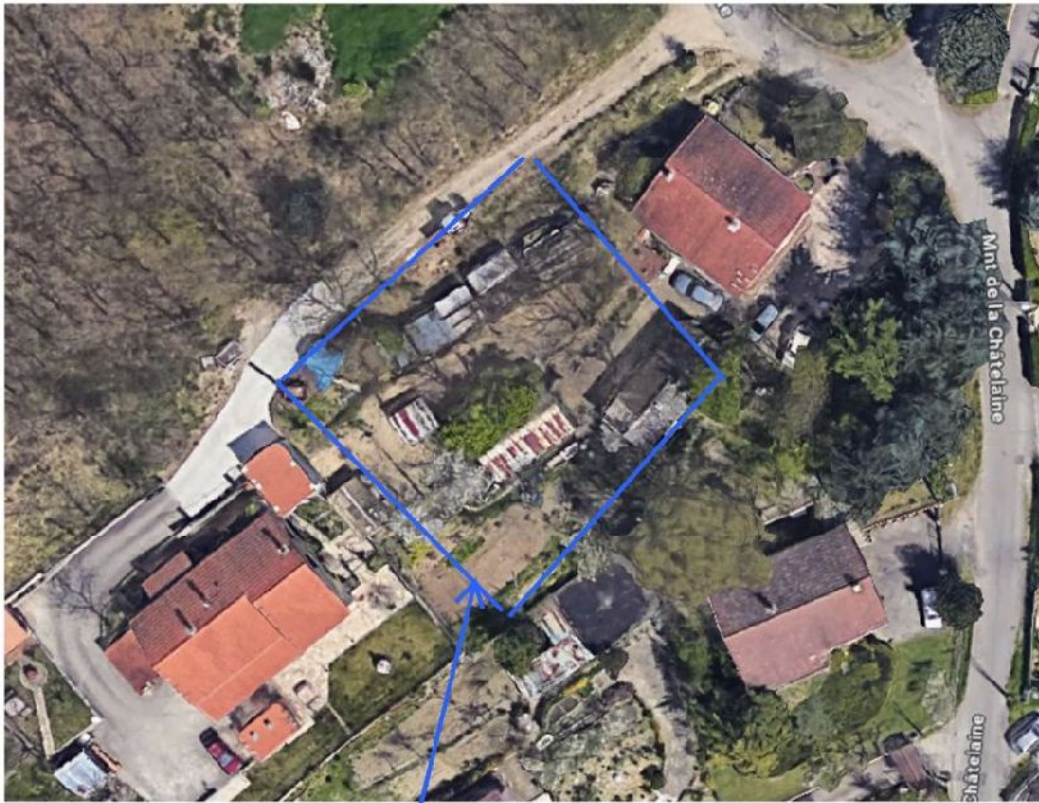
9 bis montée de la Châtelaine