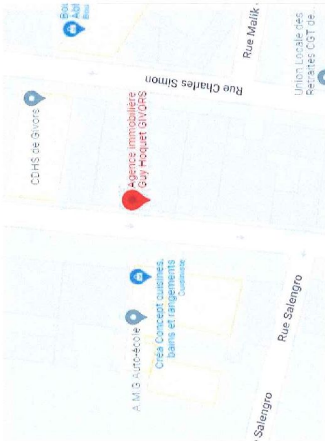
Ville de Givors

GUY HOQUET 54 rue Roger Salengro 69700 GIVORS